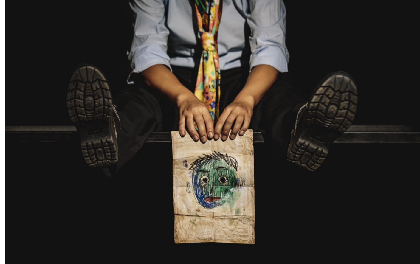
"Questa lettera sul pagliaccio morto" | Foto: Guido Mencari

A Milano dall'11 al 20 settembre Tramedautore: il festival internazionale delle drammaturgie giunto alla XX edizione e che sarà incentrato sul tema drammaticamente attuale de "I cittadini senza stato".